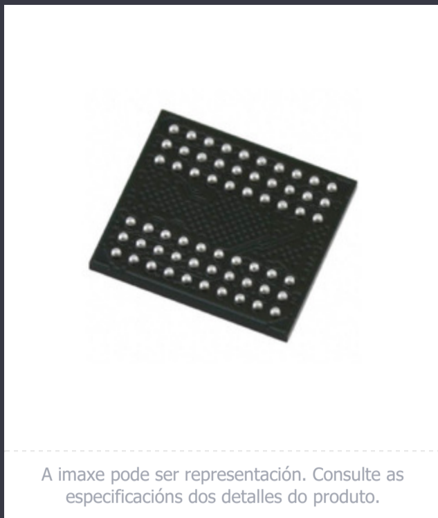
A imaxe pode ser representación. Consulte as especificacións dos detalles do produto.