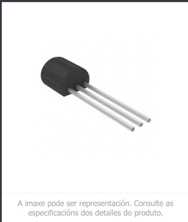
A imaxe pode ser representación. Consulte as especificacións dos detalles do produto.